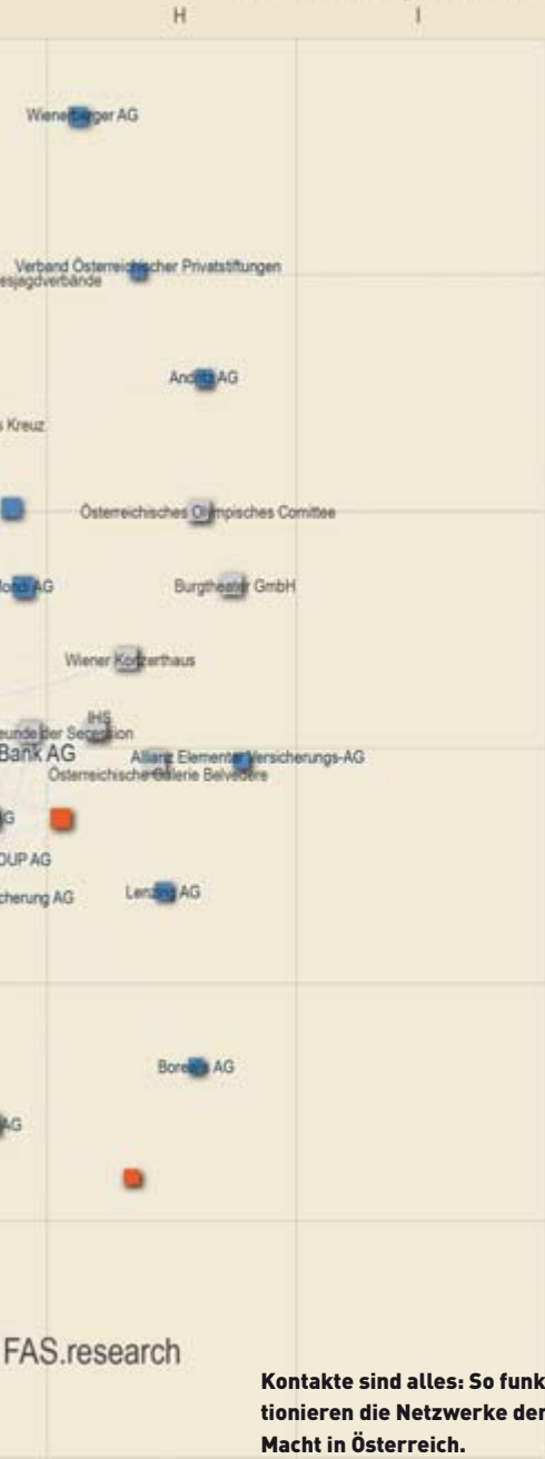
Kontakte sind alles: So funktionieren die Netzwerke der Macht in Österreich.