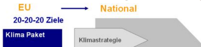
Abb. 12: Relevante EU-Politiken bzw. -Zielvorgaben und deren Umsetzungen in Österreich